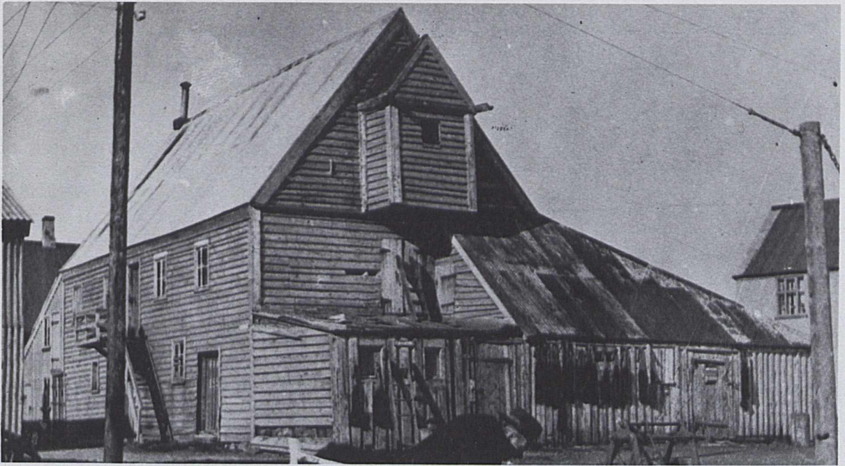
Naust í Hæstakaupstað reist af Björgvinjarkaupmönnum 1788—1791. Það var rífið árið 1943.