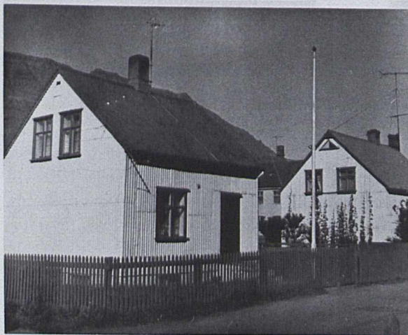
170 Íbúðarhús við Tangagötu á Ísafirði.