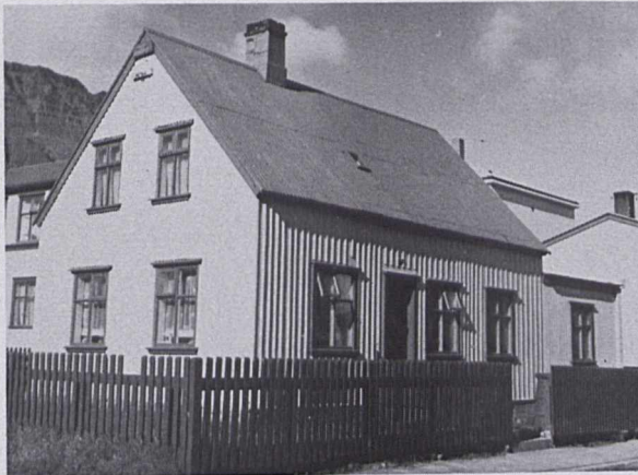
Tangagata 29 á Ísafirði.