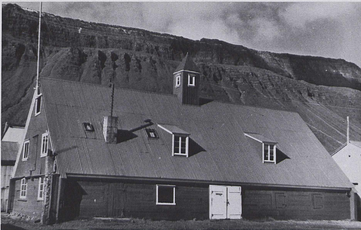
Turnhús byggt árin 1784—1785. Húsið er friðað.

innréttuð lítil veitingastofa, þar sem safngestir gætu keypt sér veitingar, þegar safnið er opið.