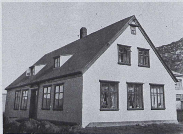
Íbúðarhús verzlunarstjórans í Hæstakaupstað, byggt árið 1788.