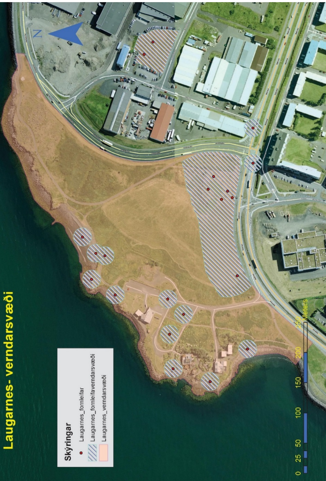
Mynd 3. Afmörkun verndarsvæðisins á Laugarnesi ásamt punktum og númerum sem sýna staðsetningar skráðra fornleifa frá árinu 2003 og fríðhelgæð svæði utan um minjarnar.